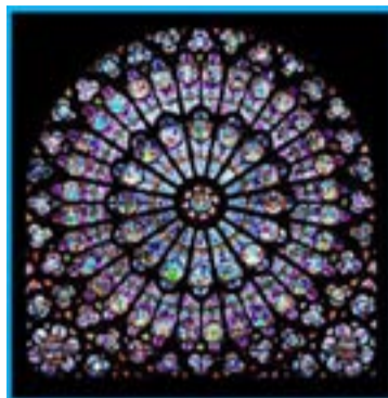
1. Roseta de Notre Dame de Paris.

Como todas las ciencias, la física tiene que inventar algunas palabras para describir los fenómenos o los descubrimientos que hace; es así como se han inventado las palabras electrón, neutrón y protón para nombrar a las partículas que forman el átomo. La Física ha bautizado muchas otras partículas, ya del uso común, como los fotones y los fonones que se relacionan con las ondas electromagnéticas y las ondas mecánicas que viajan en un material, respectivamente. En este artículo hablaremos de los plasmones que, a pesar de ser poco populares explican, por ejemplo, los brillantes colores de los vitrales de la catedral de Notre Dame (figura 1), incrementan la eficiencia de las celdas fotovoltaicas, contabilizan concentraciones de hasta una molécula en soluciones químicas, y son muy útiles en terapias contra el cáncer [1]. Descubiertos por Rufus Ritchie en 1957, los plasmones prometen revolucionar la tecnología del futuro. Recientemente, se propuso el uso de plasmones