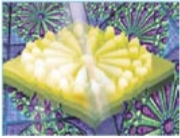
3. Primer plano: patrón tipo “roseta” conformado de nanopartículas metálicas. Plano posterior: imagen observada en un microscopio óptico después de excitar con electrones al patrón roseta. Los brillantes colores son resultado de la composición, forma y tamaño de las nanopartículas metálicas del patrón [5].

giones espaciales específicas. A este nanodispositivo se le conoce como “pinza óptica plasmónica” [7].